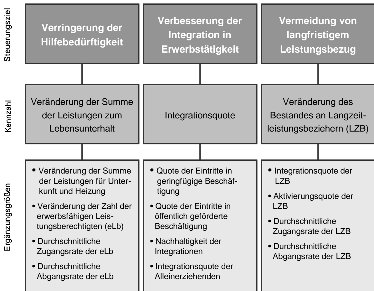
Abbildung 2: Zielsystem mit Kennzahlen und Ergänzungsgrößen

In Verbindung mit § 48a Absatz 2 SGB II ergibt sich folgendes Zielsystem mit den entsprechenden Kennzahlen und Ergänzungsgrößen. Die Kennzahlen sind maßgeblich für die Zielvereinbarungen. Die Ergänzungsgrößen dienen der ergänzenden Information und der Interpretation der Kennzahlenergebnisse (vgl. § 2 Absatz 1 Satz 3 der Verordnung zur Festlegung der Kennzahlen nach § 48a SGB II).